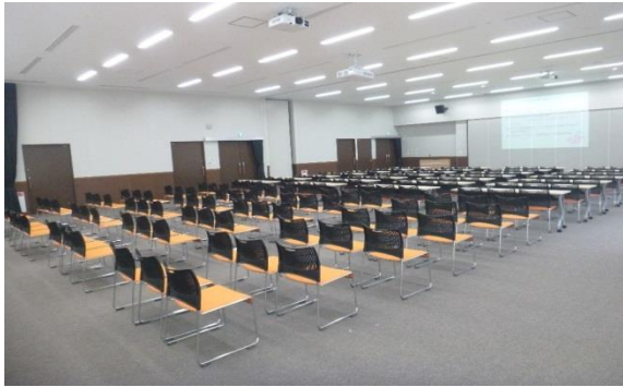
中研修室（～最大50席イスのみ） 63.2 m 2

大研修室 *設備：手動式舞台、プロジェクター、スクリーン、音響機器、ホワイトボード、無線LAN